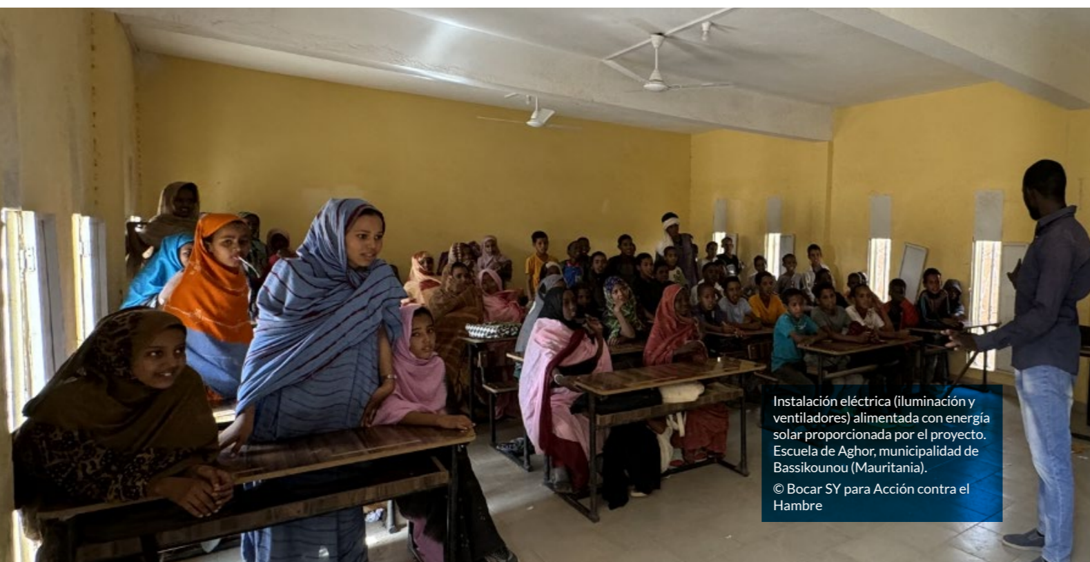
Instalación eléctrica (iluminación y ventiladores) alimentada con energía solar proporcionada por el proyecto. Escuela de Aghor, municipalidad de Bassikounou (Mauritania).

El equipo de Investigación, Desarrollo e Innovación de Acción contra el Hambre está convencido de la relevancia de la investigación operacional como medio para mejorar el impacto de la acción contra el hambre. El objetivo es fomentar el uso de las energías renovables, reduciendo así el uso de combustibles fósiles en el ámbito de la cooperación internacional y acción humanitaria. Por esta razón, el proyecto se ha enfocado en el desarrollo de una herramienta que pueda ser utilizada por todo tipo de actores interesados, tanto los encargados de tomar decisiones medioambientales a nivel nacional, provincial y municipal, como a los equipos de organizaciones sin ánimo de lucro y organismos internacionales.