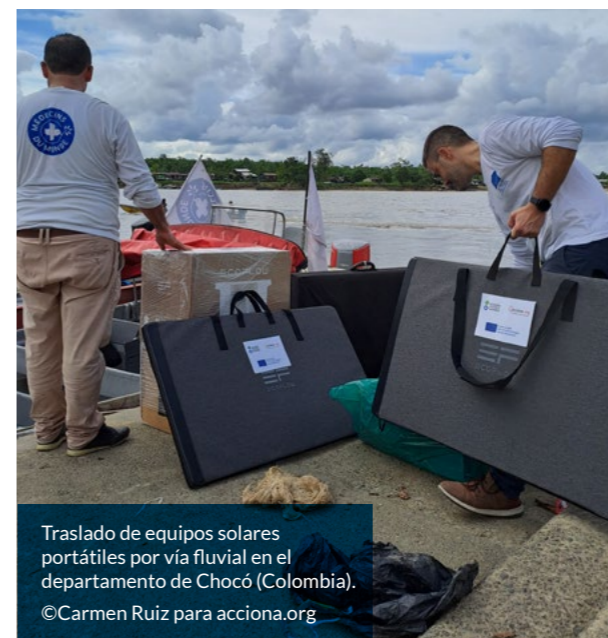
Traslado de equipos solares portátiles por vía fluvial en el departamento de Chocó (Colombia).

Al generar una herramienta de medición y manejo de energías renovable, el proyecto pretende funcionar como un catalizador de transformación y aspira a evidenciar la necesidad de implementar el uso de energías renovables a gran escala, basándose en una aplicación fundamentada en datos fiables y con una perspectiva práctica, transparente y participativa. Del mismo modo, se busca colocar en la agenda política y social el problema del uso de combustibles fósiles a la hora de ofrecer asistencia humanitaria en áreas de emergencia.